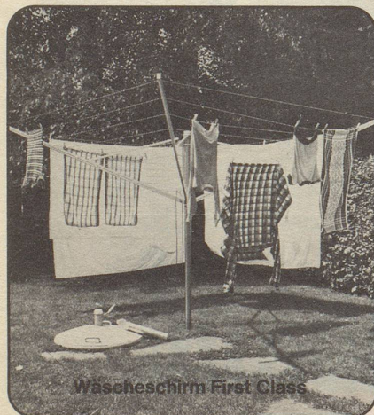
Wäschschirm First Class

100 Betten Familie Jahn Tel. 041/93 14 44, Telex 72248