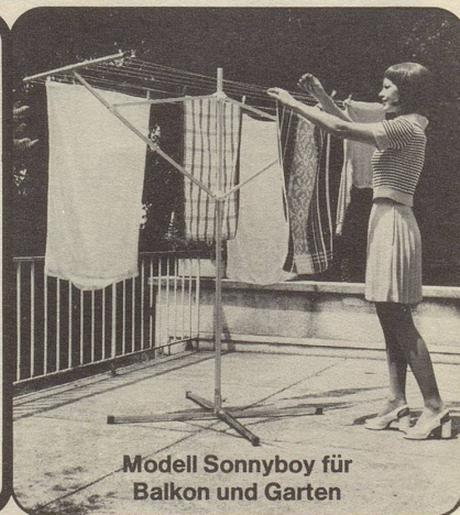
Modell Sonnyboy für Balkon und Garten

Gözl Ade AG, Metallbau, 8050 Zürich, Siewerdstrasse 95, Telefon 01-46 70 44