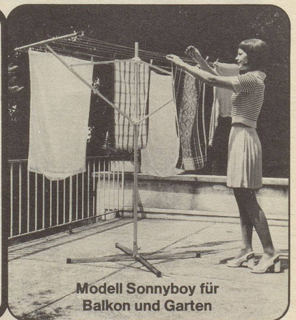
Modell Sonnyboy für Balkon und Garten