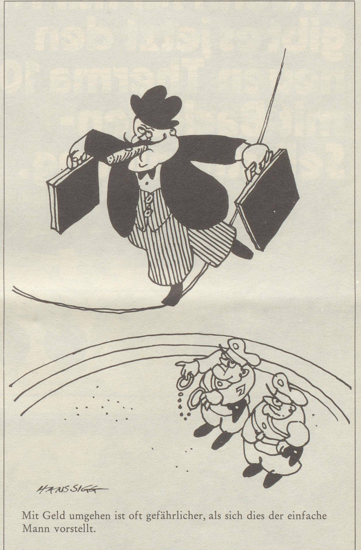
Mit Geld umgehen ist oft gefährlicher, als sich dies der einfache Mann vorstellt.

Nichtsdestoweniger muss das Spanferkel, auf diese Art zubereitet, auch nicht schlecht schmecken.