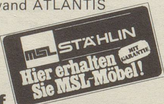
Bild: Wohnwand ATLANTIS beliebig zusammen- stellbar

Über Geschmack lässt sich streiten. Darum haben wir in unserer grossen Ausstellung ein umfangreiches Angebot in den verschiedensten Stilarten ausgestellt. Hier finden auch Sie das Möbel, welches Ihren besonderen Vorstellungen entspricht. Auch eine Riesenauswahl an Orient- und Spannteppichen, Polstergruppen, Lampen, Einbauschränken und allem, was zum Wohnen gehört, macht unsere Fabrik-Ausstellung sehenswert.