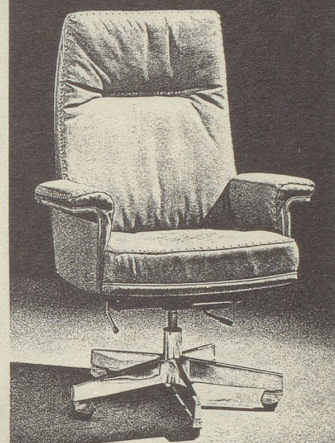
De Sede AG, 5313 Klingnau

Individualist sein – auch tagsüber De Sede Exklusive Polstermöbel