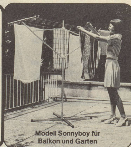
Modell Sonnyboy für Balkon und Garten

Name/Vorname _____ Strasse/Nr. _____ PLZ/Ort _____ Götz Ade AG, Metallbau, 8050 Zürich, Siewerdtstrasse 95, Telefon 01 - 46 70 44