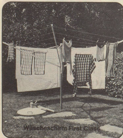
Wascheschirm First Class