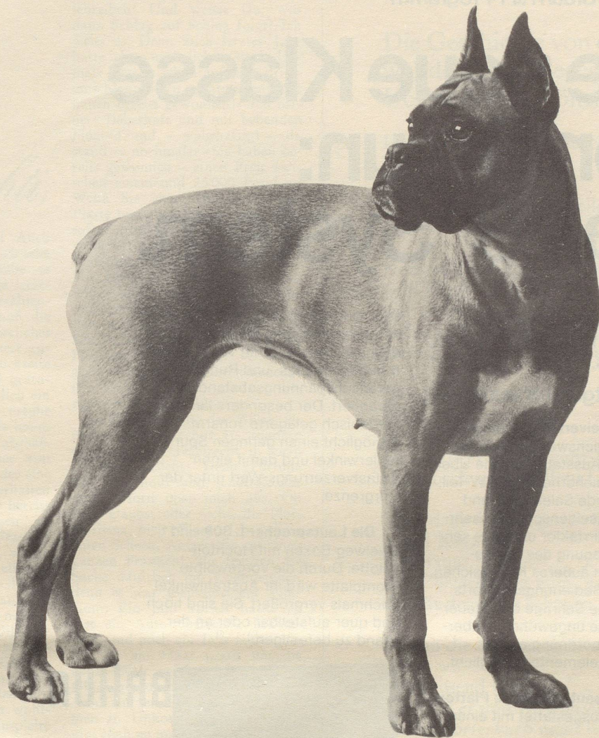
Dieser Boxer ist ein typischer Chappi-Hund: 2 1/2 Jahre alt; 25 kg schwer; schnittig; eleganter, gesunder Körperbau; kräftiger Kopf; dicke Lefzen. Hat Leistungsprüfungen bestanden.