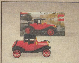
390 Cadillac Baujahr 1913.