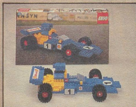
392 Formel 1-Rennwagen «Team LEGO».