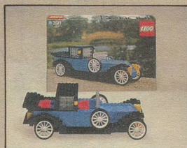
391 Renault Baujahr 1926.