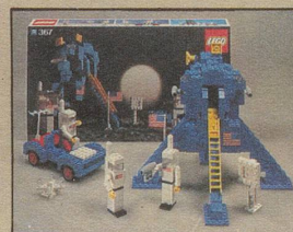
367 LEGOLAND Astronauten mit Mondlandefähre.