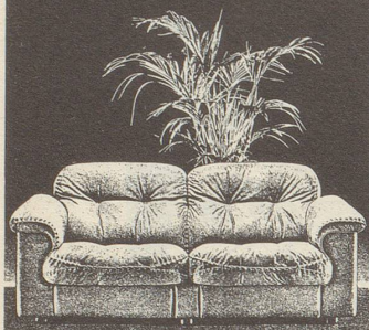
De Sede AG, 5313 Klingnau

Ein Kunde im Zoo-Geschäft tritt an den Papageienkäfig.