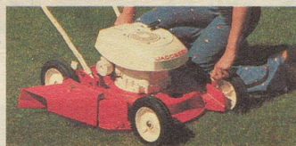
Der Jacobsen Turbocone 18, ein ausserordentlich leistungsfähiger Mäher in der mittleren Preisklasse. Der 3-PS-4-Takt-Motor hat Kraftreserven. Schnittbreite 46 cm, 5fache Schnell-Schnitthöhen-Verstellung, Windkanalgehäuse.

Das Angebot ist gross, die Wahl nicht einfach. Am häufigsten werden Messerbalken-Mäher gekauft. Sie sind robust, zuverlässig und mähen auch hohes Gras.