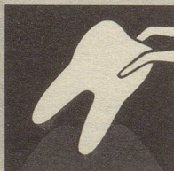
Ist das Zahnfleisch krank, so bildet es sich zurück – immer mehr. Endstufe – Zahnausfall!