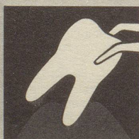
Ist das Zahnfleisch krank, so bildet es sich zurück – immer mehr. Endstufe – Zahnausfall!