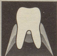
Gesundes Zahnfleisch gibt den Zähnen festen Halt.

Zahnfleischprobleme sind heute die Zahngefahr Nr. 1. Die meisten Zähne gehen infolge Zahnfleischproblemen verloren. So weit dürfen wir es nicht kommen lassen. Darum neoSelgin. Diese besondere Zahnpaste regeneriert und festigt das Zahnfleisch. Denn neoSelgin enthält hypertonisch wirkendes Meersalz – man spürt's!