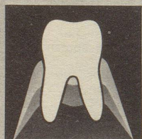
Gesundes Zahnfleisch gibt den Zähnen festen Halt.

Zahnfleischprobleme sind heute die Zahngefahr Nr. 1. Die meisten Zähne gehen infolge Zahnfleischproblemen verloren. So weit dürfen wir es nicht kommen lassen. Darum neoSelgin. Diese besondere Zahnpaste regeneriert und festigt das Zahnfleisch. Denn neoSelgin enthält hypertonisch wirkendes Meersalz – man spürt's!