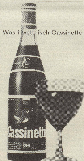
Was i wett, isch Cassinette

Cassinette ist gesundheitlich wertvoll durch seinen hohen Gehalt an fruchteigenem