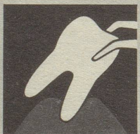
Ist das Zahnfleisch krank, so bildet es sich zurück – immer mehr. Endstufe – Zahnausfall!