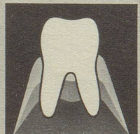
Gesundes Zahnfleisch gibt den Zähnen festen Halt.

Zahnfleischprobleme sind heute die Zahngefahr Nr. 1. Die meisten Zähne gehen infolge Zahnfleischproblemen verloren. So weit dürfen wir es nicht kommen lassen. Darum neoSelgin. Diese besondere Zahnpaste regeneriert und festigt das Zahnfleisch. Denn neoSelgin enthält hypertonisch wirkendes Meersalz – man spürt's!