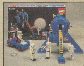
367 LEGOLAND Astronauten mit Mondlandefähre.