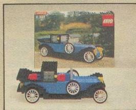
391 Renault Baujahr 1926.