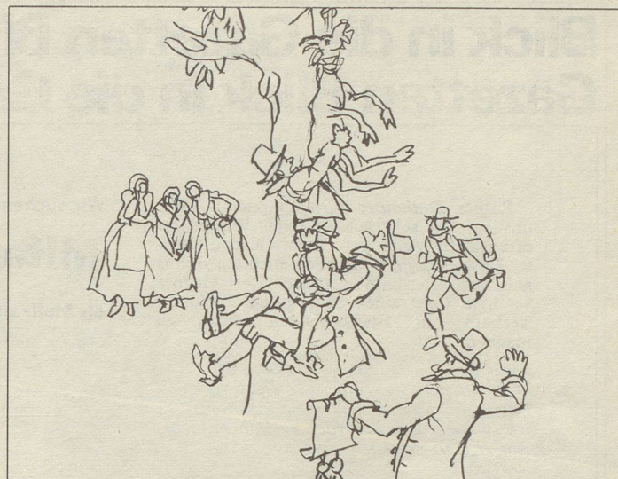
Wie Erlenbachs Honoratioren sich eulenspieglerisch an eine als Hexe zum Tod verurteilte, aber zähe Geiss des Untervogtes hängten, allesamt zu Boden purzelten und den Erlenbachern den Ueberramen «Geissehenker» bescherten.

Verkehrsverein Berner Oberland 3800 Interlaken, Telefon 036/22 26 21 Telex 33261