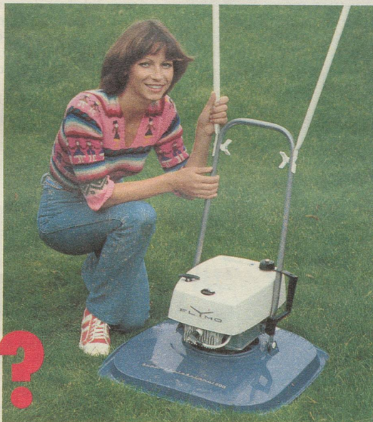
Der Luftkissen-Mäher Flymo Super-Professional mit 4-PS-2-Takt-Motor, Spezial-Schalldämpfer, Fingerzug-Starter, 3facher Schnitthöhenverstellung. Schnittbreite 47 cm, Gewicht 13 kg.

Der Ruf nach abgasfreien und leisen Rasenmähern wird immer lauter. Zwei Flymo-Modelle tragen diesen Anforderungen speziell Rechnung. Beide sind lärmgeprüft