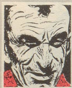
Us em Innerrhoder Witz- tröckli

Ame Mektig het en Frönte ame Puur zueglueged, wie'ner en Schöblig mit de baare Hend ggesse het. Er het si draa ene uufgreet ond het gsäat: «Zom Esse neet en aastendige Mensch Messer ond Gable!» De Puur aber meent: «Gölt ase, ond mit was häbt er denn de Schöblig?» Hannjok