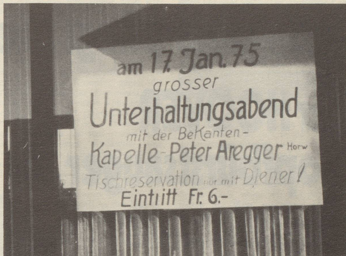
Vor einem Berggasthaus auf dem Albis

gewidmet ist, stattfinden könne. Die Künstler fanden die Idee sehr kuht pardon gut und durchaus keine Kalberei und schickten.