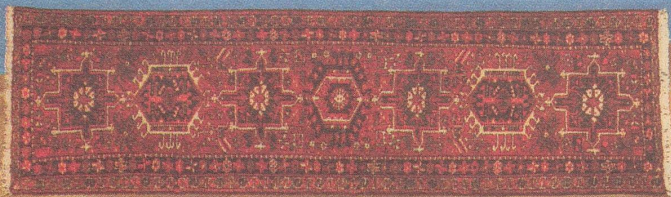
Karadja Ein preiswerter Strapazierteppich im türkischen Knoten gefertigt. Sicher ist auch Ihr Brücken- oder Läuferformat bei uns vorrätig! Ca. 157 × 57 cm

Gönnen auch Sie sich das Echte! Besuchen Sie die schönste und günstigste Orient-Teppich-Ausstellung!