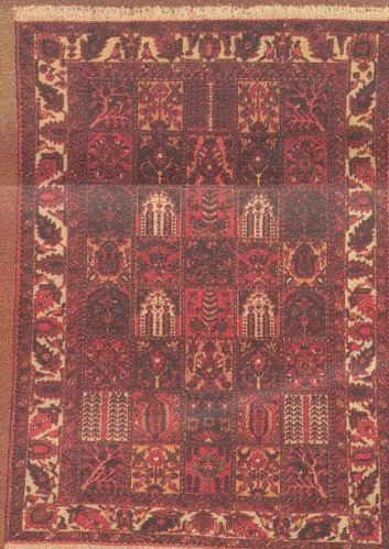
Bachtiar Der Stamm der Bachtiaeren ist im südwestlichen Mittelpersien beheimatet. Die im türkischen Knoten gefertigten Teppiche zeigen fliesenähnliche Feldereinteilungen und haben eine schwere dicke Struktur. Ca. 197 × 147 cm Fr. 915.-

Jetzt zugreifen... noch können wir diese Tiefstpreise halten!