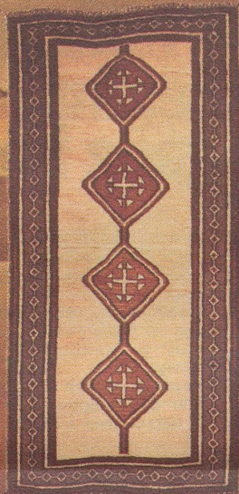
Gabeh Entdecken Sie die Schönheit des «Primitiven»! Noch können wir Ihnen eine grosse Kollektion dieser herrlichen Arbeiten der Kaschghar-Nomaden vorlegen. Ca. 112 × 197 cm Fr. 605.-

... eine echte Sonderleistung von Möbel-Märki in Preis + Qualität!