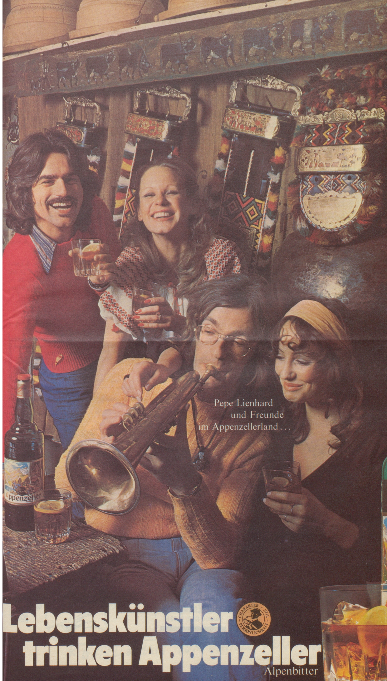
Pepe Lienhard und Freunde im Appenzellerland...

Das malerische Appenzellerland mit seiner gesunden Luft hat viele Schätze. Einer davon ist der Appenzeller Alpenbitter. Im Appenzeller Alpenbitter steckt der Reichtum unseres Alpenparadieses.