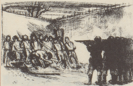
Zeitbild Abb. 8 (August 1942)

Andererseits darf nicht übersehen werden, dass die Wirksamkeit des Kampfes, den der Nebelspalter gegen den Nationalsozialismus führte, in der Schweizer Bevölkerung nie von so grosser Wirkung gewesen wäre, wenn nicht die Zensur soviel Anlass zu karikaturistischen Angriffen gegeben und also dem Nebelspalter die Möglichkeit geboten hätte, den Sack (die Zensur) zu schlagen, aber den Esel (die Nazis) zu meinen.