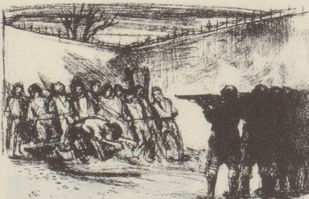
Zeitbild Abb. 8 (August 1942)

Andererseits darf nicht übersehen werden, dass die Wirksamkeit des Kampfes, den der Nebelspalter gegen den Nationalsozialismus führte, in der Schweizer Bevölkerung nie von so grosser Wirkung gewesen wäre, wenn nicht die Zensur soviel Anlass zu karikaturistischen Angriffen gegeben und also dem Nebelspalter die Möglichkeit geboten hätte, den Sack (die Zensur) zu schlagen, aber den Esel (die Nazis) zu meinen.