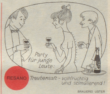
RESANO Traubensaft - vollfruchtig und stimulierend! BRAUEREI USTER