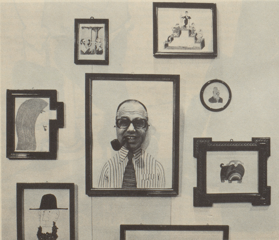
Den Rahmen gesprengt... neue Dimensionen an Jüsp's Basler Ausstellung