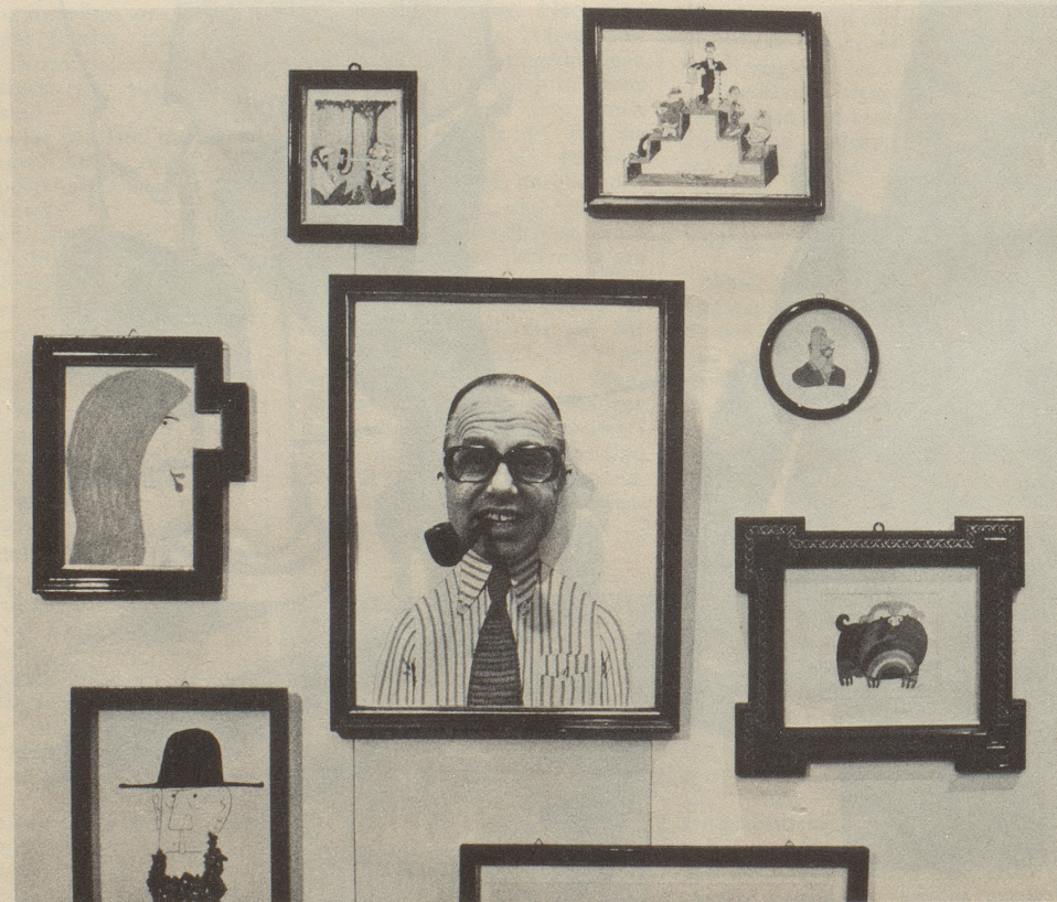
Den Rahmen gesprengt... neue Dimensionen an Jüsp's Basler Ausstellung