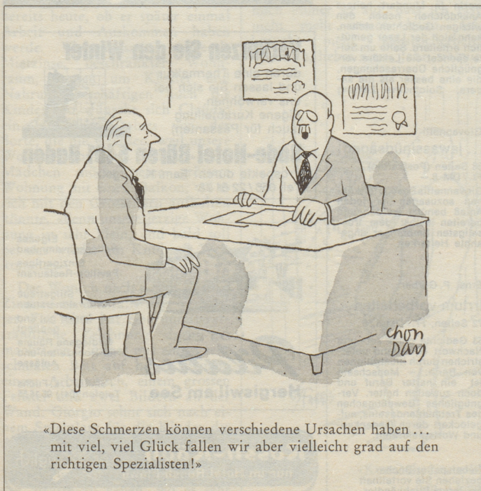
«Diese Schmerzen können verschiedene Ursachen haben ... mit viel, viel Glück fallen wir aber vielleicht grad auf den richtigen Spezialisten!»