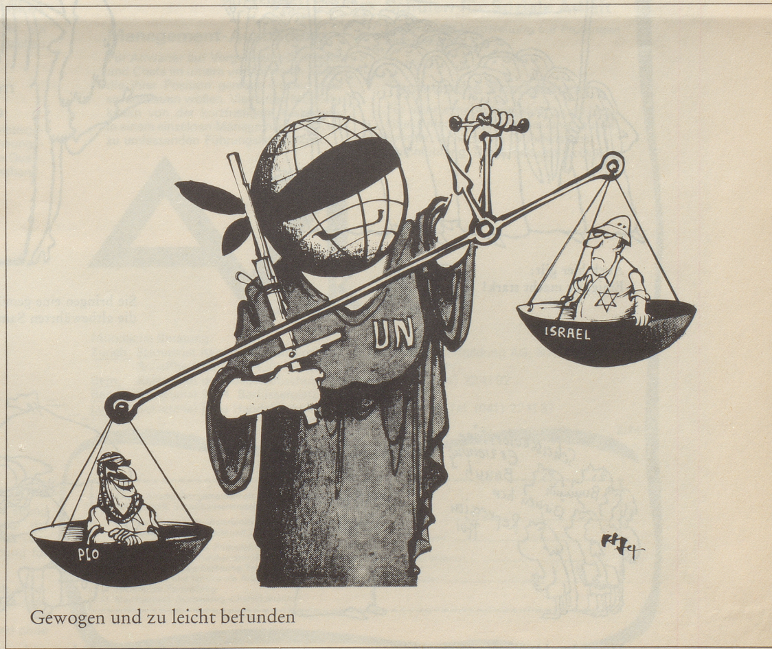
Gewogen und zu leicht befunden