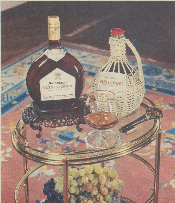
Armagnac CLES des DUCS, die Marke des Kenners

Generalvertretung: Emil Benz Import AG, 6340 Baar, Tel. 042 / 31 66 20