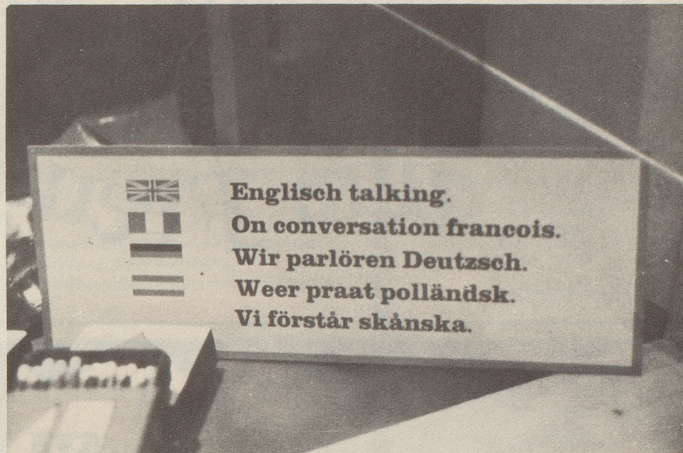
In einem Stockholmer Souvenirladen geknipst von Ueli Liechti, Zürich.

vös, Warnungen sind nie schwer, Gedichtbände sind niemals innig, die Bände nicht, nur vielleicht die Gedichte. Und eine Gabe, auch eine Formulierungsgabe, ist doch nie und nimmer klug. Und die Bilder, die Mädchenbilder sind nicht nackt, nur die darauf abgebildeten Mädchen.