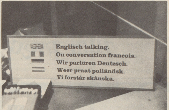
In einem Stockholmer Souvenirladen geknipst von Ueli Liechti, Zürich.

vös, Warnungen sind nie schwer, Gedichtbände sind niemals innig, die Bände nicht, nur vielleicht die Gedichte. Und eine Gabe, auch eine Formulierungsgabe, ist doch nie und nimmer klug. Und die Bilder, die Mädchenbilder sind nicht nackt, nur die darauf abgebildeten Mädchen.