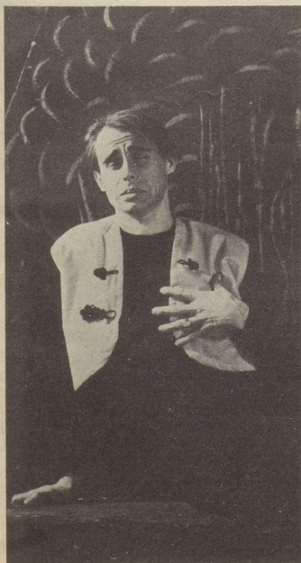
Das war Jüsp, als ich ihn kennenlernte: beim Basler Cabaret Kikeriki starb er jeden Abend den Tod des sizilianischen Banditen Giuliano. Der ganze Saal heulte (teils vor Rührung, teils vor Lachen).

Werke machen kann, die schon keine Karikaturen mehr sind, sondern zur hohen Kunst gehören. Auch wenn man vor ihnen steht und fröhlich lachen muss. Was man bekanntlich heutzutage bei Kunstwerken nur sehr, sehr selten tun kann. Wenn man schon lacht, dann höchstens über die Naivität der Leute, die so etwas ausstellen. Und über den Unverstand jener, die's kaufen und für eine Geldanlage halten.