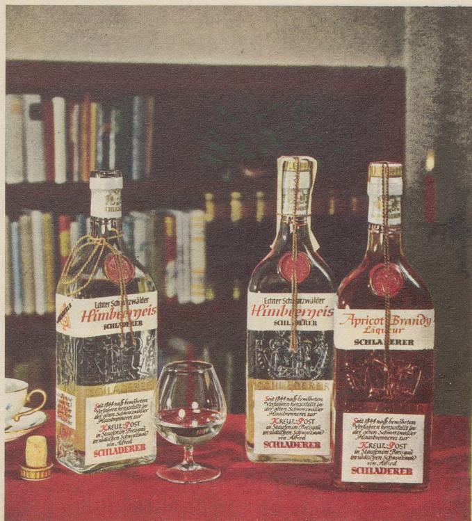
SCHLADERERS echter Schwarzwälder Himbeergeist und Apricot

Schon der Duft verheisst höchsten Genuss – das vollkommene Aroma übertrifft Ihre Erwartungen!