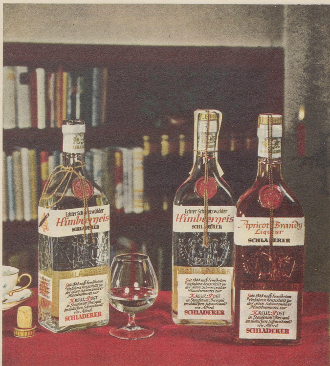
SCHLADERERs echter Schwarzwälder Himmbergeist und Apricot