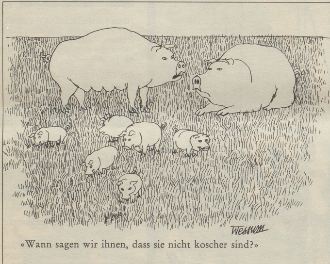
«Wann sagen wir ihnen, dass sie nicht kosher sind?»