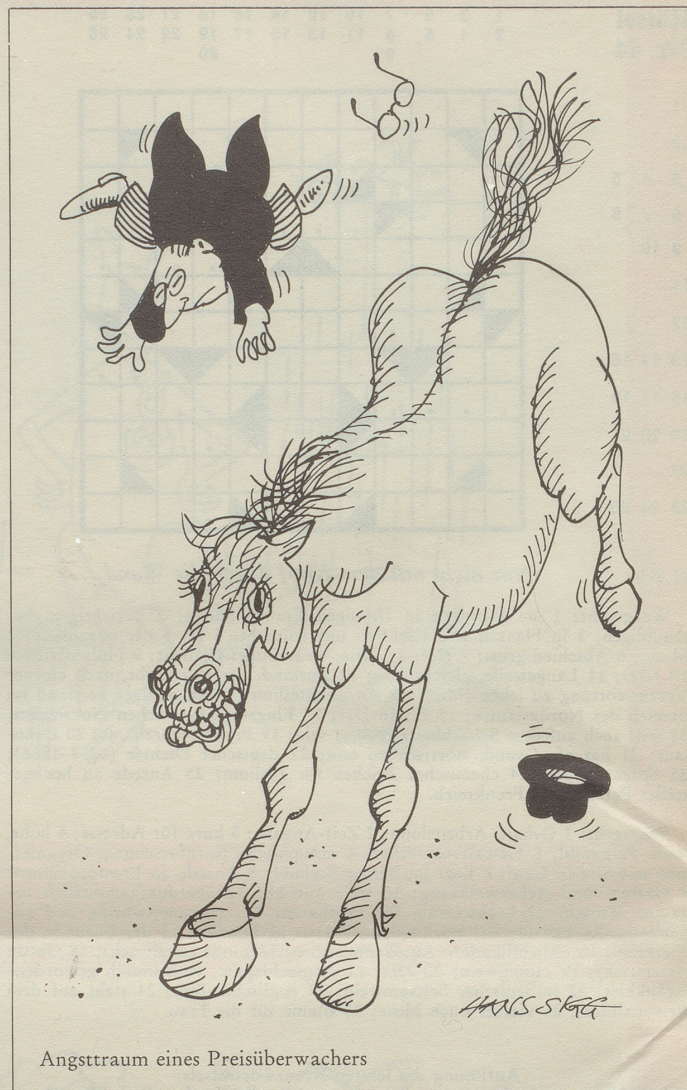
Angsttraum eines Preisüberwachers

Verlieren und verlustig gehen, in Verlust geraten ... Auch hier