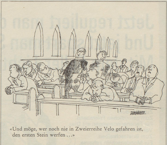
«Und möge, wer noch nie in Zweierreihe Velo gefahren ist, den ersten Stein werfen...»

Da beschloss ich, meine Aktien zu verkaufen und inskünftig Gartenstühle zu spritzen, Autos zu reparieren, Gärtnerarbeiten zu verrichten oder als Raumpfleger aufzutreten. Damit gehöre ich nun zwar nicht mehr zu den Kapitalisten, sondern zu der ausgebeuteten Arbeiterklasse – aber es ist einfach viel rentabler!