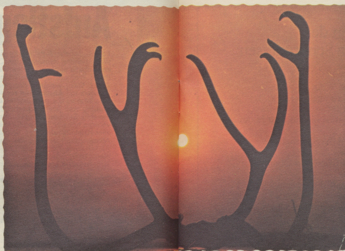
Einsender: Max Leuenberger (Muri)