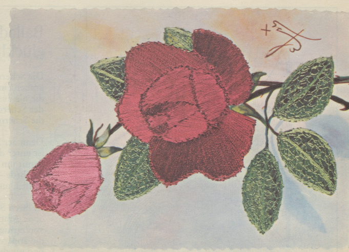
Einsender: Franz Lauber (Wabern)