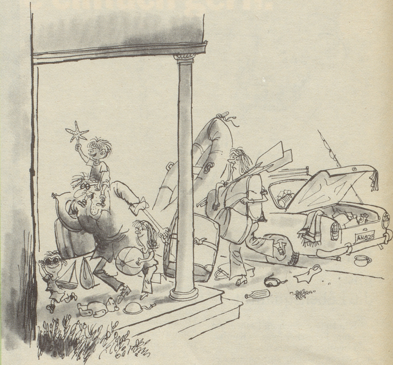
«Gott sei Dank – diese Ferien hätten wir auch wieder überstanden!»