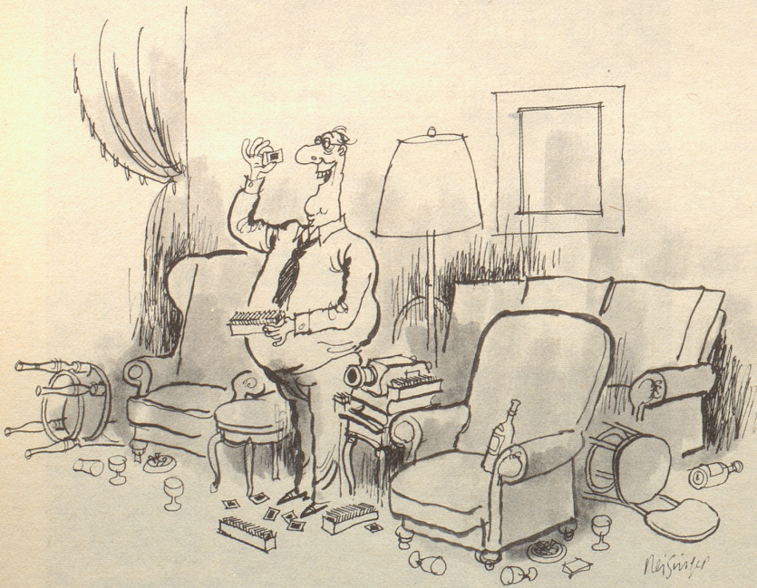
«... und jetzt, liebe Freunde, folgt unser Besuch in Rom, Florenz, Venedig und in den Dolomiten.»