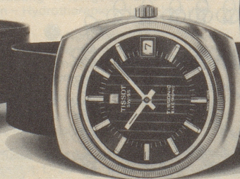
Ref. 40.614, Fr. 375.-