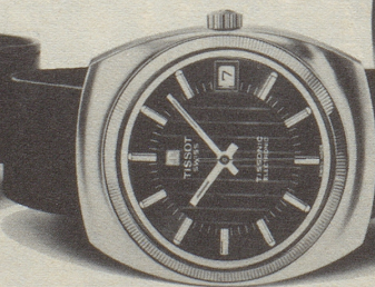
Ref. 40.614, Fr. 375.-