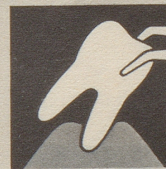
Ist das Zahnfleisch krank, so bildet es sich zurück – immer mehr. Endstufe – Zahnausfall!