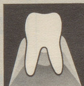
Gesundes Zahnfleisch gibt den Zähnen festen Halt.

Parodontose (Zahnfleischschwund) ist heute die Zahnkrankheit Nr. 1. Die meisten Zähne gehen infolge Parodontose verloren. So weit dürfen wir es nicht kommen lassen. Darum neoSelgin. Diese besondere Zahnpaste regeneriert und festigt das Zahnfleisch. Denn neoSelgin enthält hypertonisch wirkendes Meersalz – man spürt's!