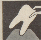
Ist das Zahnfleisch krank, so bildet es sich zurück – immer mehr. Endstufe – Zahnausfall!