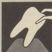
Ist das Zahnfleisch krank, so bildet es sich zurück – immer mehr. Endstufe – Zahnausfall!