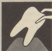
Ist das Zahnfleisch krank, so bildet es sich zurück – immer mehr. Endstufe – Zahnausfall!