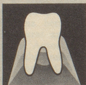
Gesundes Zahnfleisch gibt den Zähnen festen Halt.

Parodontose (Zahnfleischschwund) ist heute die Zahnkrankheit Nr. 1. Die meisten Zähne gehen infolge Parodontose verloren. So weit dürfen wir es nicht kommen lassen. Darum neoSelgin. Diese besondere Zahnpaste regeneriert und festigt das Zahnfleisch. Denn neoSelgin enthält hypertonic wirkendes Meersalz – man spürt's!