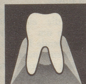
Gesundes Zahnfleisch gibt den Zähnen festen Halt.

Parodontose (Zahnfleischschwund) ist heute die Zahnkrankheit Nr. 1. Die meisten Zähne gehen infolge Parodontose verloren. So weit dürfen wir es nicht kommen lassen. Darum neoSelgin. Diese besondere Zahnpaste regeneriert und festigt das Zahnfleisch. Denn neoSelgin enthält hypertonic wirkendes Meersalz – man spürt's!