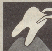
Ist das Zahnfleisch krank, so bildet es sich zurück – immer mehr. Endstufe – Zahnausfall!