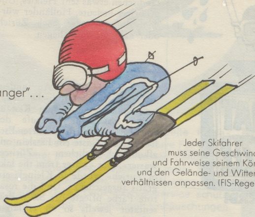
Jeder Skifahrer muss seine Geschwindigkeit und Fahrweise seinem Können und den Gelände- und Witterungsverhältnissen anpassen. (FIS-Regel Nr. 2)