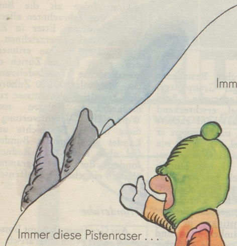
Immer diese Pistenraser ...