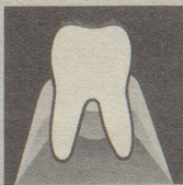
Gesundes Zahnfleisch gibt den Zähnen festen Halt.

Parodontose (Zahnfleischschwund) ist heute die Zahnkrankheit Nr. 1. Die meisten Zähne gehen infolge Parodontose verloren. So weit dürfen wir es nicht kommen lassen. Darum neoSelgin. Diese besondere Zahnpaste regeneriert und festigt das Zahnfleisch. Denn neoSelgin enthält hypertonisch wirkendes Meersalz – man spürt's!