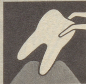
Ist das Zahnfleisch krank, so bildet es sich zurück – immer mehr. Endstufe – Zahnausfall!