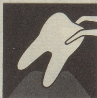
Ist das Zahnfleisch krank, so bildet es sich zurück – immer mehr. Endstufe – Zahnausfall!