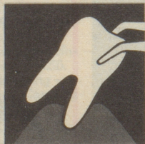
Ist das Zahnfleisch krank, so bildet es sich zurück – immer mehr. Endstufe – Zahnausfall!