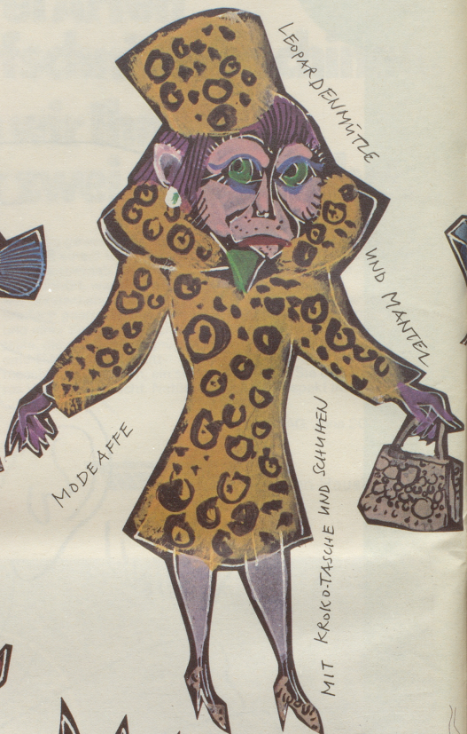
LEOPAR DEN MITZE

17 JUBILÄUMS GESCHENKE AN DEN BASLER ZOLLI, VON Matti