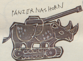
PÄNZER NAS HORN