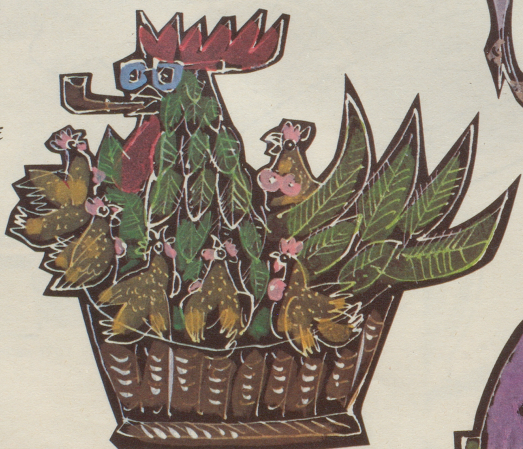
HAHN IM KORB