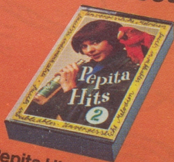
Pepita Hits Nr. 2 «Unvergängliche Musik aus grossen Filmen»