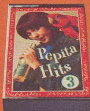
Pepita Hits Nr. 3 «Unvergessliche Melodien aus grossen Musicals»