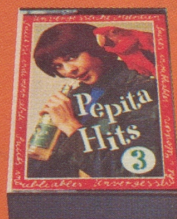
Pepita Hits Nr. 3 «Unvergessliche Melodien aus grossen Musicals»