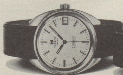
Ref. 40.613, Fr. 345.-