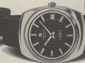
Ref. 40.614, Fr. 375.-