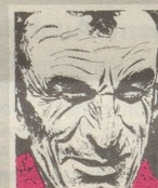
Usen Innerrhoder Witz- tröckli

«Nein, sie verlangte, dass die Hochzeitsanzeige ihren Namen fetter und grösser gedruckt brin- gen müsse als meinen.» *