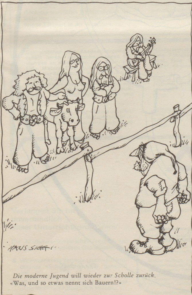
Die moderne Jugend will wieder zur Scholle zurück. «Was, und so etwas nennt sich Bauern!?»

Dann wachte ich auf – nur ein Albtraum! Oder war ich etwa doch keine Vollsweizerin...? Die Wirklichkeit gewisser Vorfälle im Bundeshaus war schliesslich auch so etwas wie ein böser Traum. (Ob nach jener «Halbschweizer-Qualifikation» jetzt endlich ein paar aufwachen?)